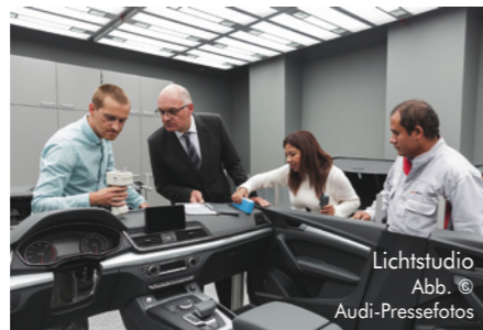
Lichtstudio und Harmonie-Raum